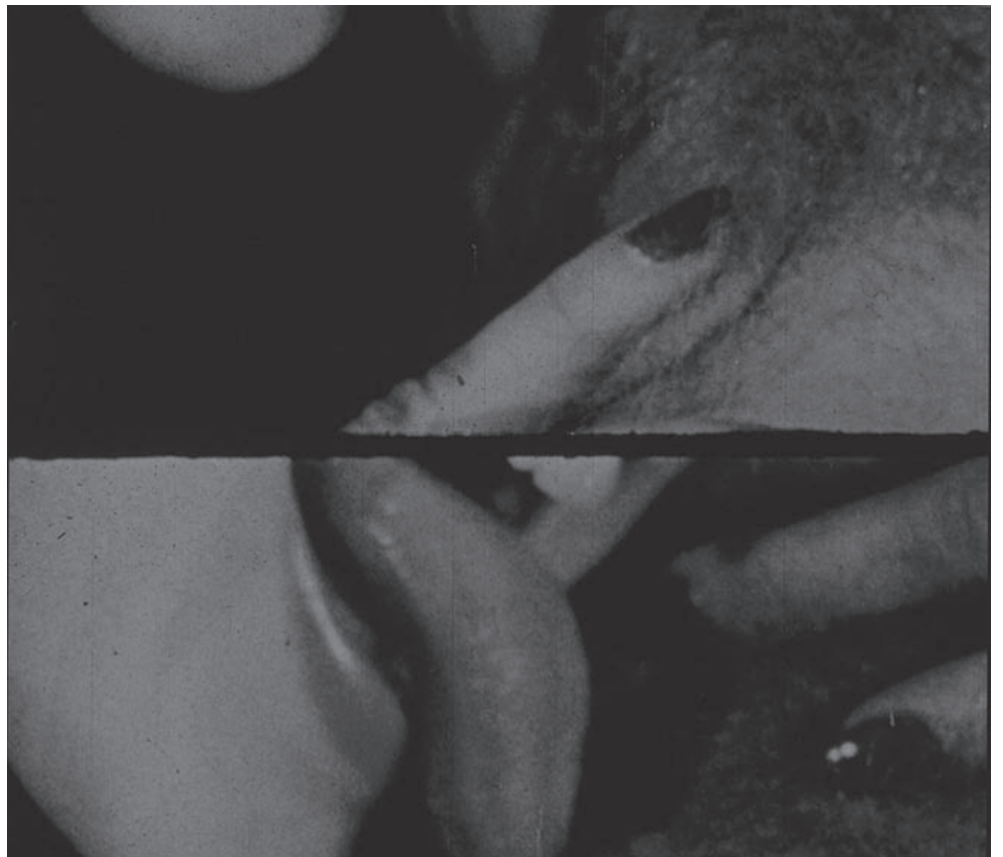
- X n°6, 2003, tirage argentique sur aluminium, 70 x 78 cm, © Éric Rondepierre

Site d'Éric Rondepierre : www.ericrondepierre.com